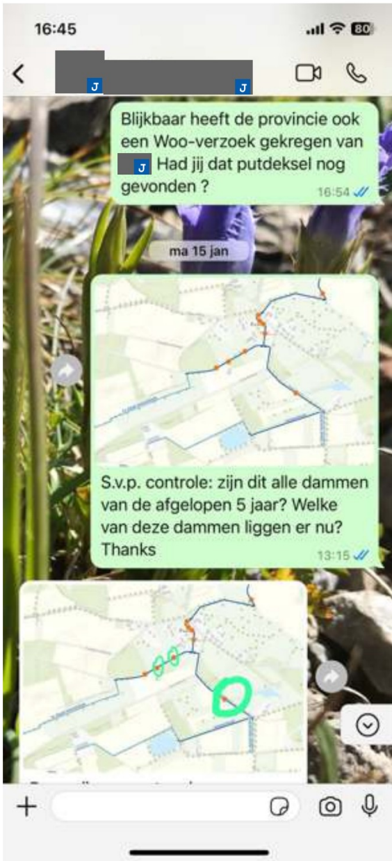
Verstuurd vanaf mijn iPhone