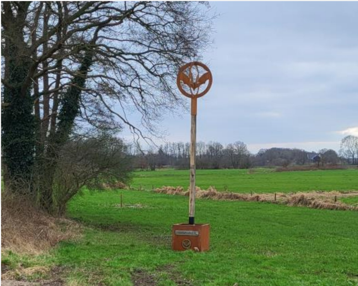
Figuur 9. Vleermuisbaken op paal in verplaatsbare bak, met op foto het type FaunaFlex.