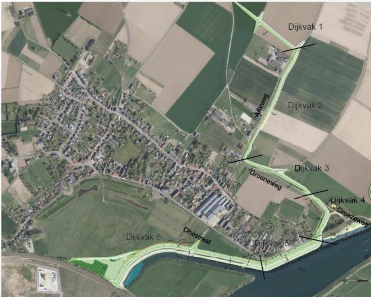
Figuur 5. Luchtfoto met daarop het ontwerp geprojecteerd, en een duiding van de verschillende dijkvakken waarin het plangebied is opgedeeld.

Het plangebied is opgedeeld in dijkvakken, zoals weergegeven in figuur 5. Een grotere afbeelding hiervan is opgenomen als bijlage 1 bij deze rapportage. In deeltraject 1 (dijkvak 1, 2, 3 en 4) ligt in de huidige situatie nog geen dijk, behalve in een deel van de Groeneweg in dijkvak 3. De nieuw aan te leggen dijk in dijkvak 1, loopt over de Arixweg en gaat ten noorden van het perceel van nummer 18 de hoek om, om aan te sluiten op de noordelijke hoge grond bij de Spitwitweg. Er wordt in dijktraject 1 een kleikist aangebracht. De dijk loopt in dijkvak 2 over landbouwpercelen langs de Groeneweg. Het eigendom van de gronden waarop de dijk komt te liggen wijzigt. Dit gaat van de particuliere en gemeentelijke eigenaren over naar het eigendom van waterschap Limburg. Alle percelen blijven bereikbaar door middel van dijkovergangen. De achtergelegen dorpskern is, na de aanleg van de dijk, beschermd tegen hoogwater volgens de nieuwe wettelijke veiligheidsnorm.