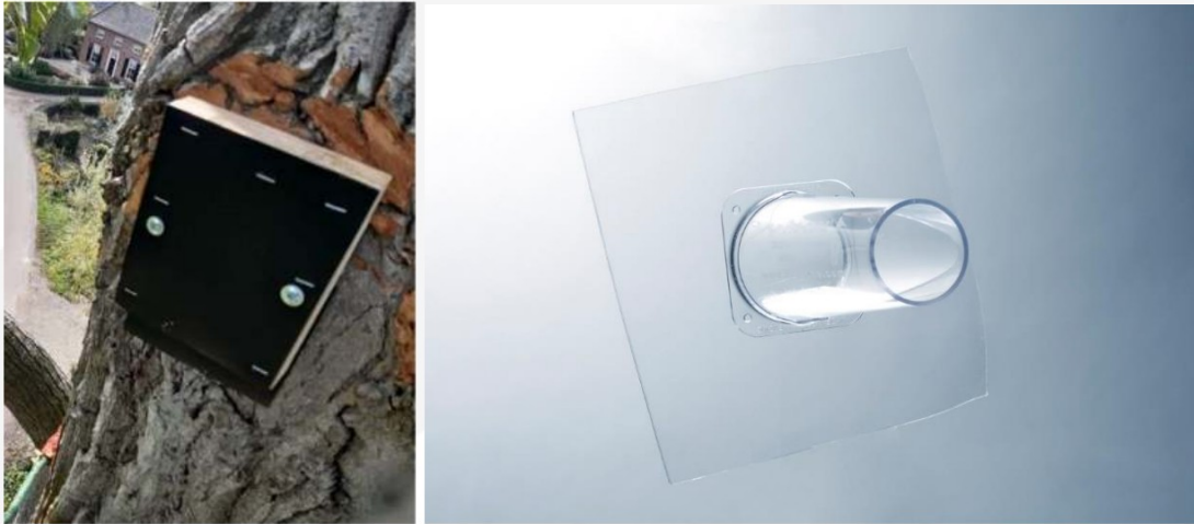
Figuur 11. Voorbeelden van twee manieren om vleermuizen op vleermuisvriendelijke wijze uit een boomholte te verdrijven, met links op de foto een degelijke exclusion-flap en rechts de batcone.