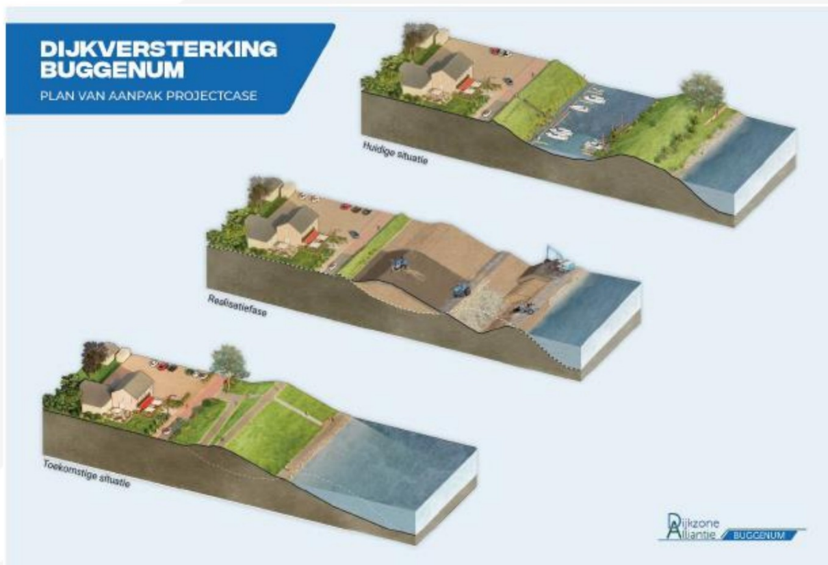
Figuur 6. Visualisatie van het profiel van de watergang en dijk in de huidige situatie, realisatiefase en toekomstige situatie (bron: Dijkzone Alliantie).

In dijkvak 6 loopt de te versterken dijk aan de buitenzijde van Buggenummerbroek. Het tracé volgt hier de huidige kering die loopt vanaf het Kop van het End (waar de kering aansluit op de Dorpsstraat) langs het koelwaterkanaal van de voormalige Nuon Centrale tot aan het spoorlichaam. Tussen Dorpsstraat en Toerit Ohéstraat is geen pipingopgave meer, behalve ter plaatse van de kruising van de overstortleiding. Hier aan beide zijden van de leiding een pipingscherm aangebracht. Tussen de Ohéstraat en het spoor is wel een pipingopgave. Deze wordt opgelost met een pipingscherm tussen de toerit aan de Ohéstraat en de beheertoerit aan de binnenzijde. Het hiervoor toepassen/hergebruiken van de vrijkomende damwand uit de bestaande nooddijk in dijkvak 5 wordt gezien als een kans. In het zuidelijk deel van dijkvak 6, tussen de beheertoerit aan het spoor, waar pipingmaatregelen niet realiseerbaar zijn, is gekozen voor een achterlandverbetering waarbij een pipingberm/ophoging van het achterland wordt toegepast. Dit omdat het ongewenst is vanwege omgevingsbeïnvloeding van het spoor een damwand aan te brengen, de afwatering en ruimtelijke kwaliteit van het gebied wordt verbeterd.