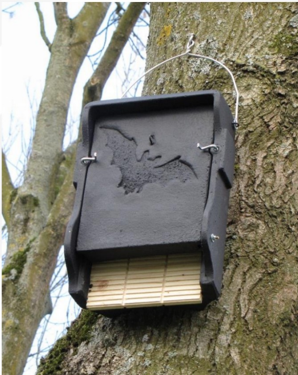
Figuur 10. Voorbeelden van vleermuiskasten welke gebruikt kunnen worden als permanente paarverblijfplaats voor aan bomen voor alle boombewonende soorten die mogelijk aanwezig kunnen zijn in het plangebied, met op foto de 1FF kast van Schwegler.

gebruik te maken van duurzame vleermuiskasten van houtbeton met een lange levensduur. Doordat zowel soorten welke een voorkeur hebben voor spleetvormige ruimtes als voor holtes aanwezig kunnen zijn worden vleermuiskasten toegepast waarvan bekend is dat deze door alle boombewonende soorten als paarverblijf gebruikt kunnen worden (b.v. Schwegler type 1FF, zie figuur 10). Een vleermuisdeskundige kan in de directe omgeving van het plangebied de meest geschikte locaties voor de vleermuiskasten bepalen, rekening houdend met de beschikbaarheid van te behouden bomen, verlichting en territoriaal gedrag van vleermuizen rondom hun paarverblijfplaatsen. Op grond van de resultaten uit het onderzoek kunnen de kasten zodanig opgehangen worden dat deze buiten reeds bestaande territoria hangen welke behouden blijven bij de ingreep. Alleen dan ontstaan ook daadwerkelijk nieuwe alternatieven buiten de reeds bezette territoria.