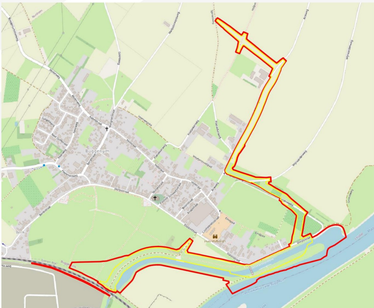
Figuur 1. Ligging van het plangebied, met de begrenzing daarvan in rood weergegeven. Het permanent ruimtebeslag is hierop met geel weergegeven.

Het plangebied bestaat uit het tracé voor de dijkversterking Buggenum, gelegen in en rondom Buggenum in gemeente Leudal (Limburg). De ligging van het plangebied is weergegeven in figuur 1. Bij de ingreep is het plangebied opgedeeld in Dijkvakken. Een luchtfoto van het plangebied met daarop duiding van de betreffende dijkvakken is opgenomen als bijlage 1.