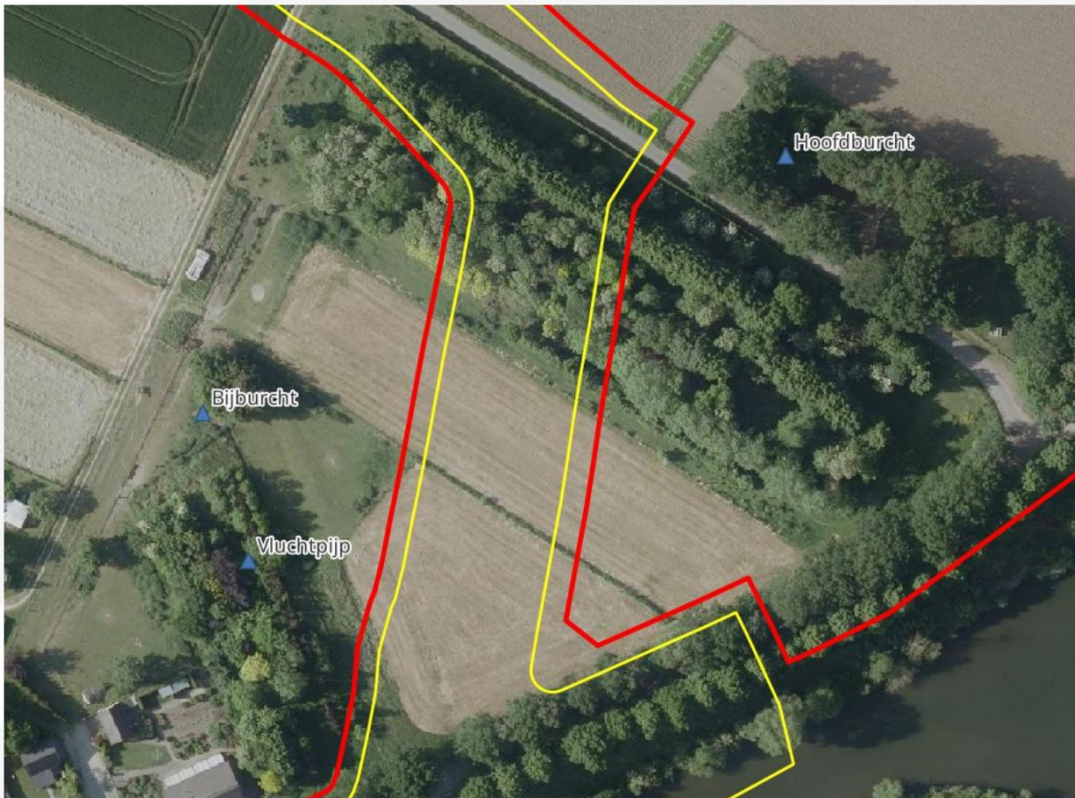
Figuur 3. Luchtfoto van een deel van het plangebied met de contouren daarvan met rood weergegeven. Het permanent ruimtebeslag is met geel weergegeven. De bij het veldonderzoek aangetroffen vaste rust- en verblijfplaatsen van dassen zijn daarop met blauwe driehoeken weergegeven.