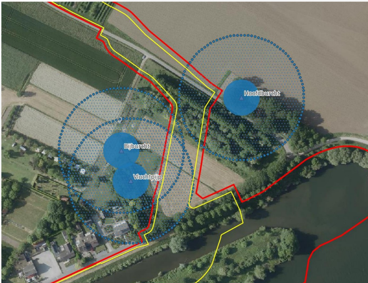
Figuur 7. Luchtfoto van een deel van het plangebied met de contouren daarvan met rood weergegeven. Het permanent ruimtebeslag is met geel weergegeven. Vaste rust- en verblijfplaatsen van dassen zijn daarop met blauwe driehoeken weergegeven. Een bufferzone van 20 m en 50 m daaromheen zijn met blauw gearceerd weergegeven.

In het spoortalud is een dassentunnel aanwezig. Deze zou gedicht moeten worden om lekkages bij hoogwater via de tunnel te voorkomen. Omdat dit mogelijk negatieve effecten op de das kan hebben omdat het spoortalud daarmee weer een grotere barrière gaat vormen wordt de volgende maatregelen getroffen om dit te voorkomen: