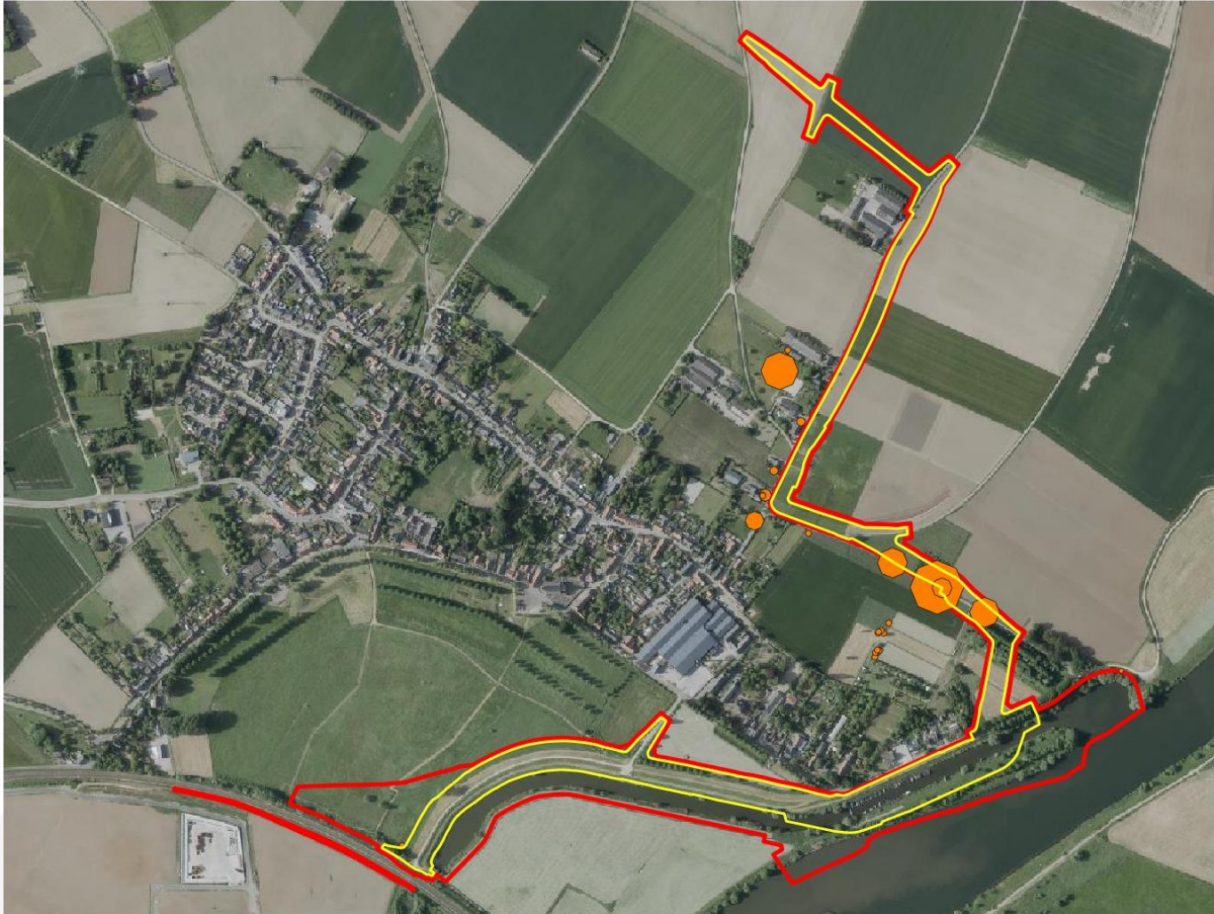
Figuur 2. Luchtfoto van een deel van het plangebied, met de contouren daarvan in rood weergegeven. Het permanent ruimtebeslag is met geel weergegeven. Bekende recente waarnemingen uit de NDFF van de steenuil zijn hierop met oranje weergegeven