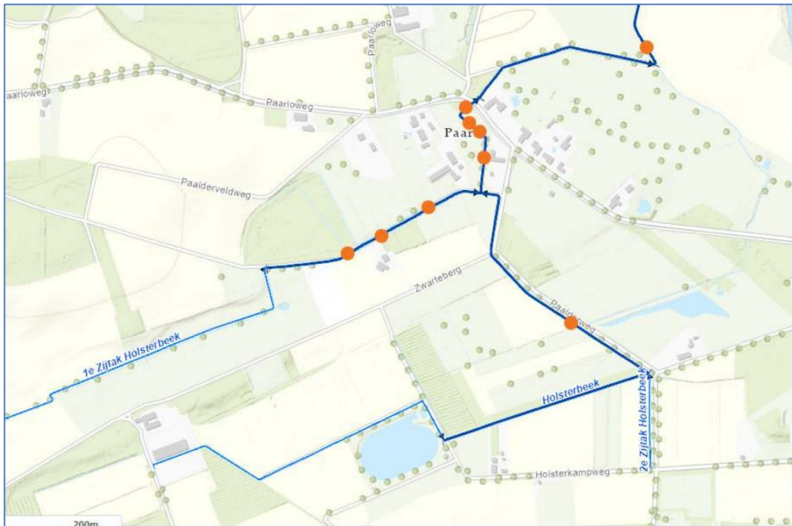
Figuur 1. Beverdammen Holsterbeek

Op de bijgevoegde kaart zijn de beverdammen aangegeven die de laatste 5 jaar aanwezig waren in de Holsterbeek (inclusief de eerste en tweede zijtak).